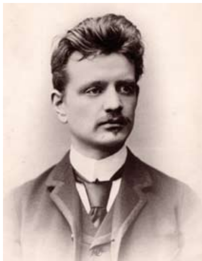
Jean Sibelius (1865-1957) sai syntymäpäivänsä almanakkaan vuosikerrasta 2011 lähtien. Kuvassa Sibelius nuorena musiikinopiskelijana 1800-luvun lopulla.

Sibeliuksen päivä on joulukuussa, jolloin pohjoisimmassa Suomessa ei aurinko näy lainkaan. Nykyisten säännösten mukaan pitäisi liputuspäivänä liputtaa kello 8:sta auringonlaskuun. Jotta Pohjois-Suomikin voi kunnioittaa Sibeliusa, suositellaan Sibeliuksen päivänä liputusta kaikkialla Suomessa kello 8–16.