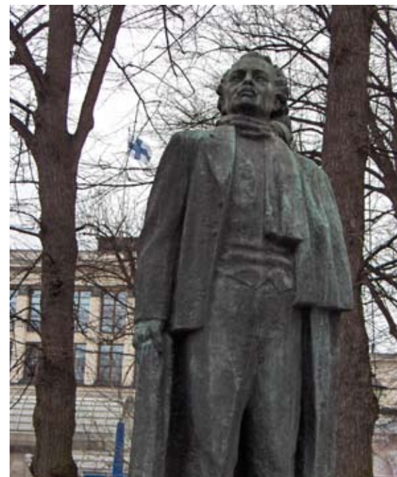
Eino Leinon patsas Helsingissä Esplanadin puistossa. Patsaan jalustaan on kaiverrettu säkeet: "Yksi on laulu ylitse muiden, ihmisen, aatteen, hengen ankara laulu."