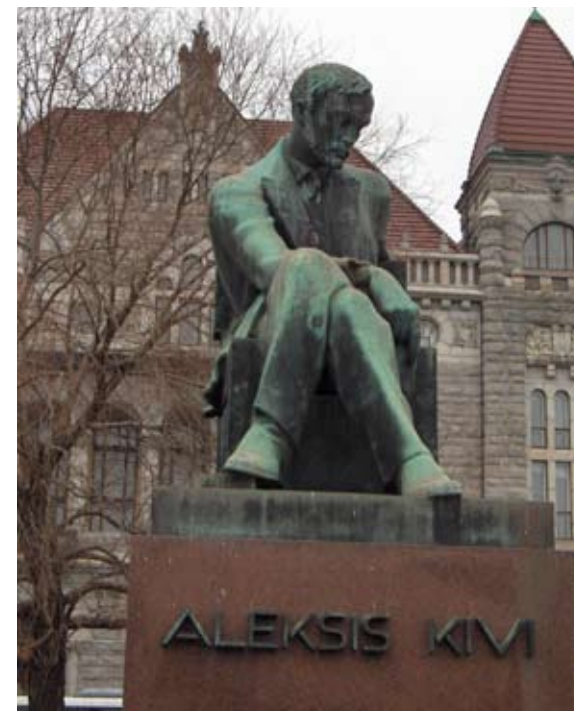
Aleksis Kiven patsas Helsingin Rautatien torilla Kansallisteatterin edessä. Kivellä on patsas lisäksi ainakin Nurmijärvelle ja Tampereella.

YK on valinnut vuoden varrelle useita merkki- ja teemapäiviä, joita se suosittelee vietettäväksi kaikissa jäsenvaltioissaan. Seuraavan aukeaman laatikossa on lueteltu YK:n suosittelemia päiviä. Näistä kansainvälinen naistenpäivä, YK:n päivä ja lasten päivä on otettu mukaan suomalaiseen almanakkaan.