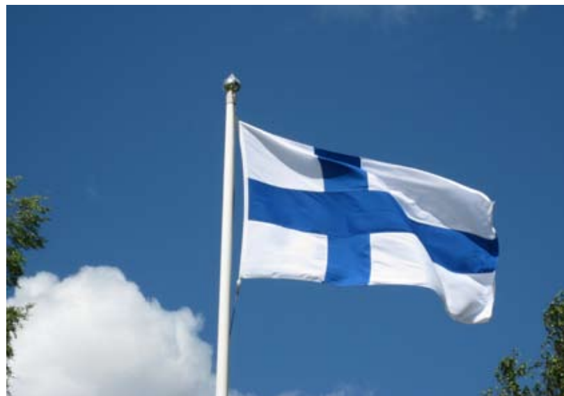
Juhannus on Suomen lipun päivä.

toukokuun kolmatta sunnuntaita vietettävä "nyt päättyneessä sodassa kaatuneiden sankarivainajien sekä myös kaikkien murroskautena 1918 molemmin puolin vakaumuksensa puolesta henkensä uhranneiden yhteisenä uskonnollisena muistopäivänä".