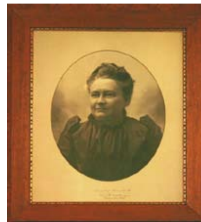
Minna Canth (1844–1897) sai oman liputuspäivän kalentereihin vuosikerrasta 2007 alkaen.