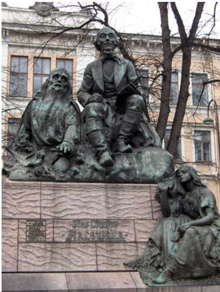
Elias Lönnrotille pystytetty patsas Helsingissä Lönnrotinkadun varrella. Lönnrotilla on patsas lisäksi ainakin Kajaanisssa, Nurmeksessa ja Sammatissa.

Yleiseksi liputuspäiväksi Kalevalan päivä alkoi vakiintua 1920-luvulla, ja almanakassa on päivä merkitty liputuspäiväluetteloon vuodesta 1952 alkaen. Vuoden 1978 uudessa lippuasetuksessa Kalevalan päivä on virallinen liputuspäivä. Se sai samalla toisen määreen "suomalaisen kulttuurin päivä".