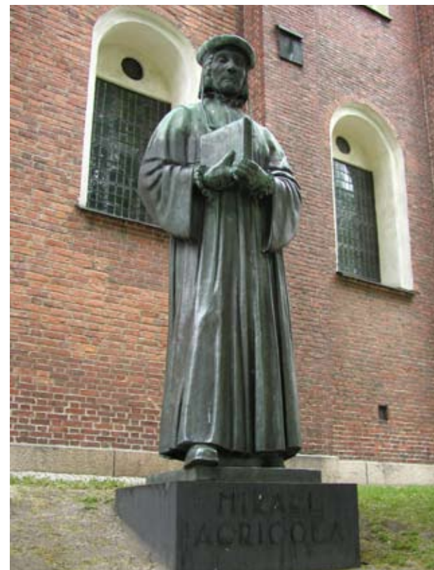
Mikael Agricolan patsas Turun tuomiokirkon edustalla.

on syntynyt samana päivänä, 9. huhtikuuta (vuonna 1802). Päivä valittiin Eljaksen nimipäiväksi jo 1927.