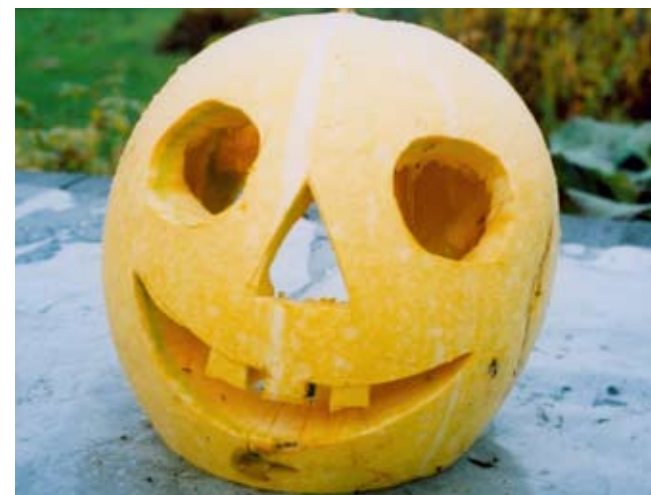
Kurpitsajuhla halloween on pesiytmässä myös Suomeen.

Jos päivä päätetään ottaa mukaan Yliopiston almanakkaan, se samalla tulee automaattisesti mukaan lähes kaikkiin muihinkin suomalaisiin kalentereihin. Yliopiston almanakkatoimisto nimittäin merkitsee päivän omaan "päivälistansa", jonka suosituksia useimmat suomalaiset kalenterinvalmistajat noudattavat.