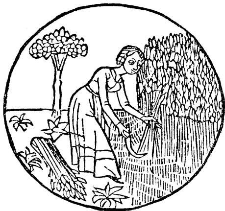
Elokuun askareita Johannes von Gmundenin kalenterissa: Sadonkorjuuta.

K un Suomi kuului 1700-luvulla Ruotsin vallan alle, oli almanakassa punaisella värillä merkittynä kulloisenkin kuningasperheen merkkipäiviä, joita myös tavallinen rahvas sai viettää vapaapäivinä. Esimerkiksi 1730-luvulla juhlittiin Fridrikin, Eleonoran ja Ulrican päiviä.