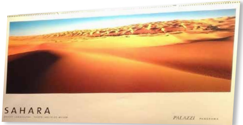
Palazzin kustantama lähes metrin levyinen Sahara-panoramakalenteri.

ryhminään, samoin kuin puutarha- ja ruokakalenterit. Erikoisempia teemoja edustivat esimerkiksi majakka- ja juna-aiheet kalenterit.