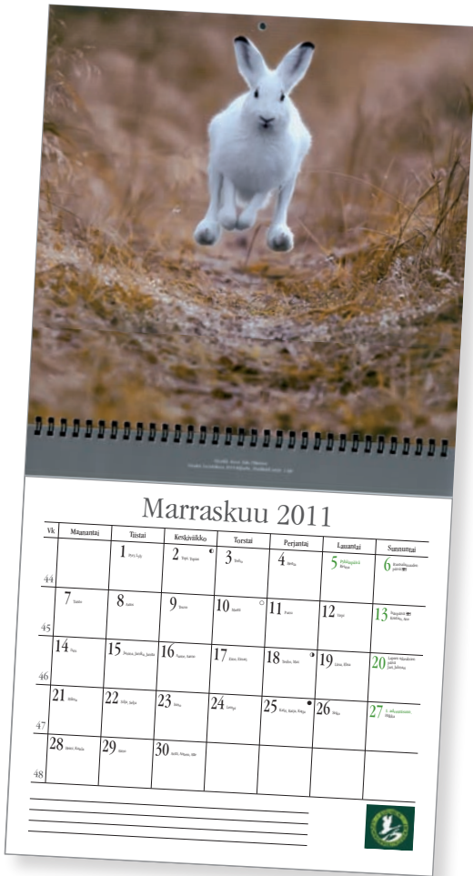
Suomen Luonnonvalokuvaajat ry:n kalenteria koristaa Esko Pitkäsén mestarikuva vauhdikkaasta jäniksestä.