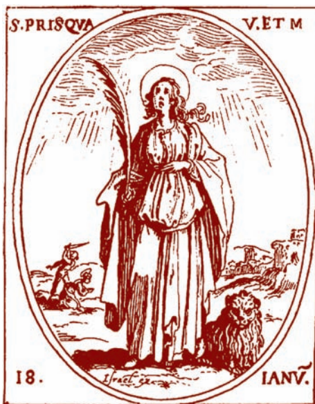
Alkuperäinen Priska-neito oli 13-vuotias roomalaistyttö, joka kärsi marttyyrikuoleman 100- tai 200-luvulla. Jacques Callot'n piirros vuodelta 1636. (Kuva ensi syksynä ilmestyvästä kirjasta Suomen kansan pyhimyskalenteri.)

Ortodokseilla on toisenlainen nimikäytäntö kuin luterilaisessa kirjossa. Lapselle valitaan hengelliseksi