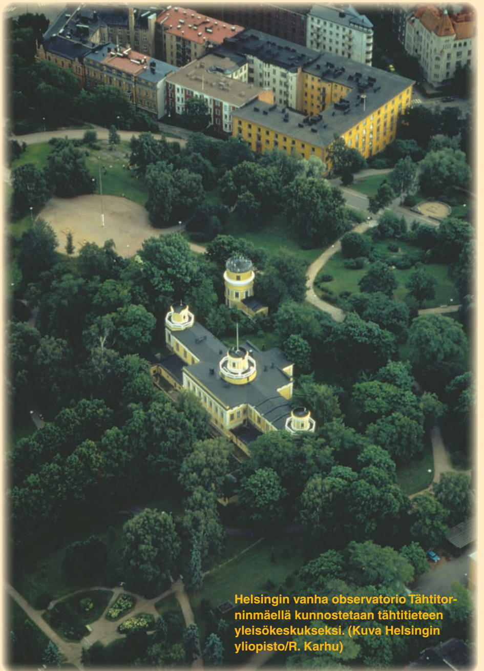
Helsingin vanha observatorio Tähtitornimäellä kunnostetaan tähtitieteen yleisökeskukseksi.

Almanakkatoimiston PL-osoite, puhelinnumerot ja sähköpostit säilyvät ennallaan. Vain käynti-osoite on muuttunut. Toimisto on remontin ajan Helsingin yliopiston tiloissa Vallilassa osoitteessa Teollisuuskatu 23 A, huone A623. Takaisin observatorioon almanakkatoimisto pääsee keväällä 2012.