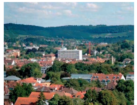
Ajaston kalenterit tehdään syksystä alkaen Saksassa Heilbronnin kaupungissa. Kuvan keskellä näkyy Schneiderin kalenteritehdas.

1.4. Suomeen perustettiin uusi yhtiö Ajasto Paperproducts Oy, joka jatkaa Ajaston toimintaa.