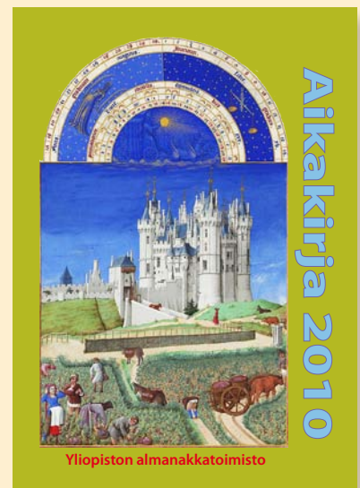
Painopaikka: Painokarelia 2010

Aikakirja 2010:n sisältö: 1. 50 kysymystä ajasta ja kalenterista. 2. Ajanlaskun aakkosia. 3. Ajanmittaus. 4. Luonnon merkkipäiviä vuoden varrella. 5. Kirkkovuoden juhlat. 6. Kansalliset ja kansainväliset merkkipäivät. 7. Suomalaisen almanakan kehitys. Kirjan voi ladata omalle koneelleen verkosta pdf-muodossa joko kerrallaan tai yhtenä kokonaisuena pdf:nä. Kirjassa on 272 sivua.