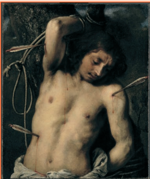
Pyhä Sebastianus. Juan Carreño de Mirandan maalaus noin vuodelta 1660.