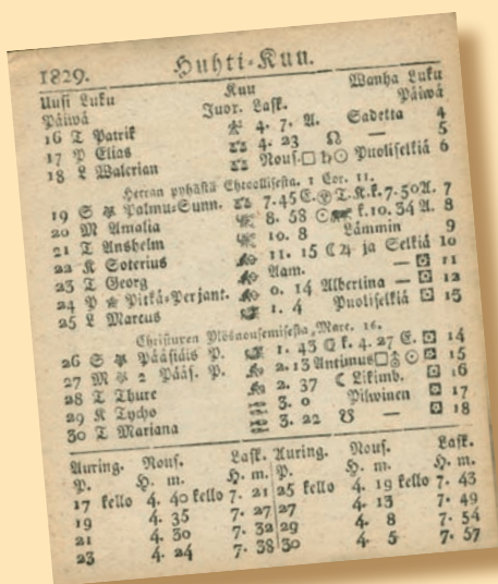
Vuoden 1829 almanakassa pääsiäissunnuntai oli huhtikuun 26. päivänä.

Jos pääsiäinen olisi nykyaikanakin laskettu todellisista taivaan ilmiöistä, olisimme viettäneet pääsiäistä 26.4. myös vuonna 1981.