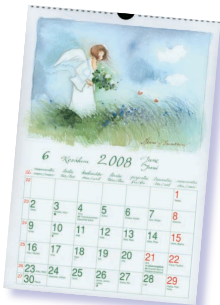
Minna-Kortin enkelikalenterin kesäkuun enkeli.

VUODEN 2008 KALENTERIT – ENKELEITÄ JA PALOMIEHIÄ S. 2