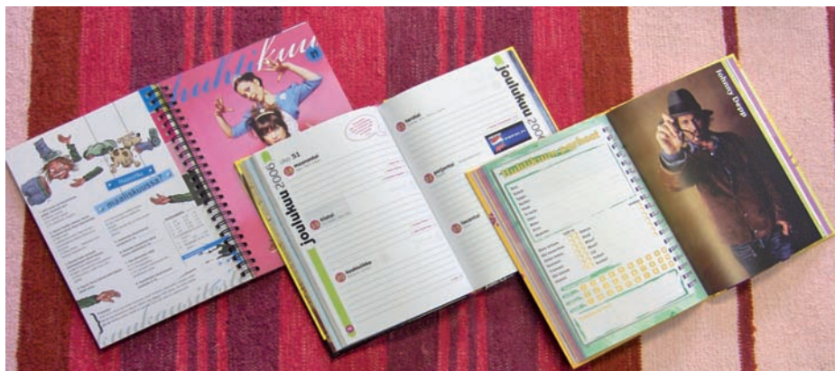
Nuorten kalentereissa pitää olla vauhdikasta menoa. (Kalenterit Suosikki/Yhtyneet Kuvalehdet, Pop&Rock/Aller Julkaisut, Demi/A-lehdet)

Kiviniemen tietokoneissa pyörii yli kymmenen miljoonaa suomalaista etunimeä runsaan sadan vuoden ajalta. Ne ovat kertoneet tutkijoille monia kiintoisia asioita. Esimerkiksi sen, että suomalaiset ovat viime aikoina tykättyneet harvinaisiin ja ainutkertaisiin nimiin. Kun Kivi-