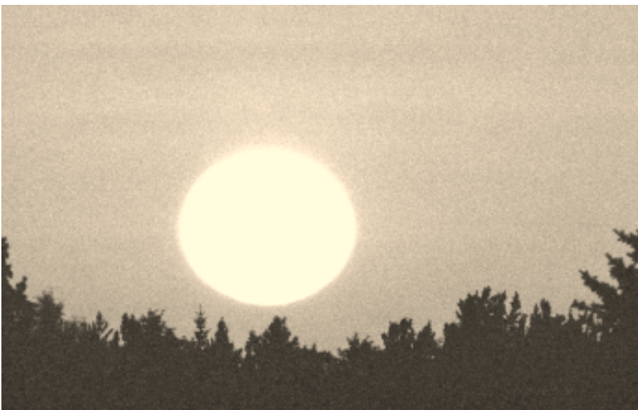
Pilkistääkö kesäyön aurinko Keminkin eteläpuolella?

Kun yöttömiä öiden raja kulkee lähes asteen napapiiriä etelämpänä, kulkee vastaavasti kaamosen raja lähes asteen napapiiriä pohjoisempana. Sodankylässä ja sitä pohjoisempana on joulun aikaan aurinko ”pesässään” eikä näyttäytymään lainkaan. ☺