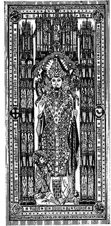
Piispa Henrik sai oman pyhäpäivän.

Viattomien lasten päivä oli py- häpäivä, neljäs joulupäivä, jo 1700- luvun almanakoissa. Vuonna 1772 se kuitenkin muutettiin arkipäi- väksi. Pyhän Henrikin muistopäi- vä sen sijaan ei ole ollut Suomessa koskaan aikaisemmin pyhäpäivä.